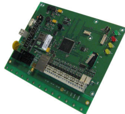
TSEC 3000 E versie 10-28VDC