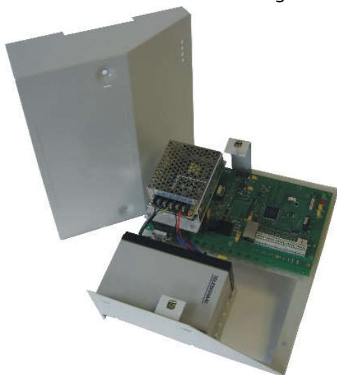
TSEC 3000 C versie 90-260VAC