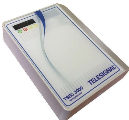
TSEC 3000 E kunststof behuizing 10-28VDC