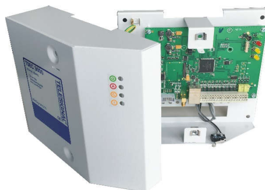
TSEC 3000 E metalen behuizing 10-28VDC